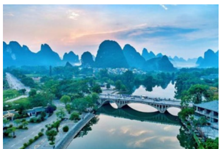
La ciudad de Guilin