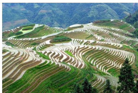
Terrazas de Arroz de Longsheng