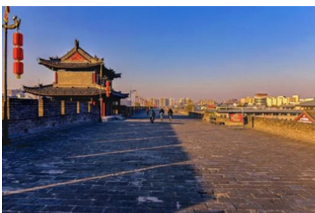
Muralla antigua de la ciudad