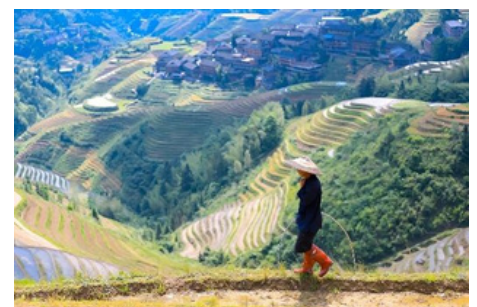
Terrazas de Arroz de Longsheng