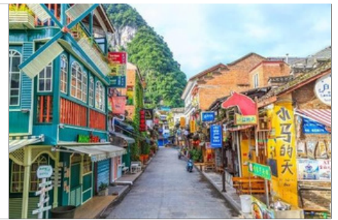
Calle del Oeste de Yangshuo