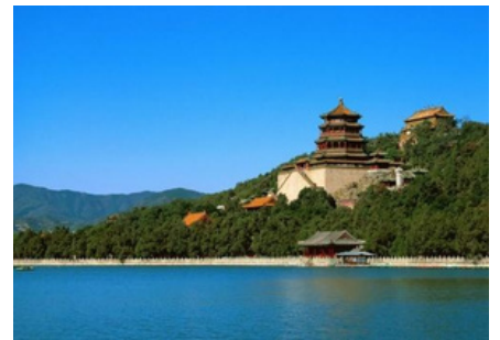
Palacio de Verano