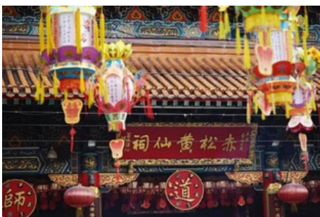
Templo Wong Tai Sin

A continuación, visitaremos el Mercado de Stanley , un popular mercado al aire libre. Es conocido por su gran variedad de ropa barata, recuerdos y otros artículos. El mercado se extiende por varias calles peatonales y callejones, creando un ambiente animado y bullicioso. Allí, puede intentar regatear con los dueños de las tiendas y comprar algunos recuerdos locales para su familia y amigos.