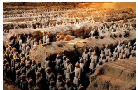
Guerreros y Caballos de Terracota