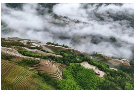
Terrazas de Arroz de Longsheng

Después, se le llevará a la estación de tren y va a tomar el tren de alta velocidad estimado G2249 19:42-22:04 de Guilin a Canton. Después de la llegada, su guía en Canton le trasladará al hotel.