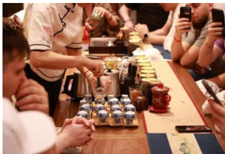
Ceremonia del Té