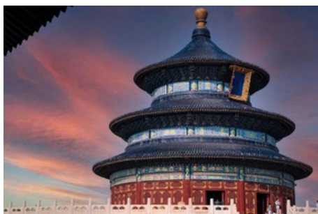
Templo del Cielo