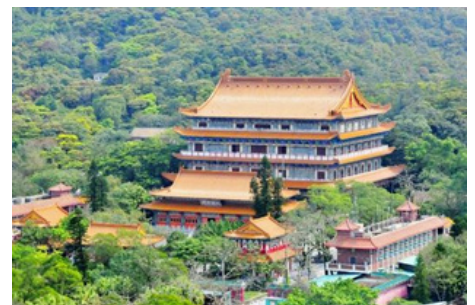
Monasterio Po Lin