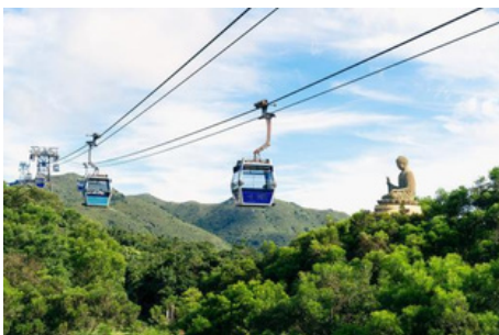
Teleférico Ngong Ping 360

El Gran Buda y el Monasterio Po Lin son grandes atracciones turísticas para los turistas. El Gran Buda es una estatua de bronce de 34 metros de altura y 250 toneladas de peso, situada en la cima de Ngong Ping, la parte más alta de la isla de Lantau. El Buda está sentado sobre una flor de loto, rodeado de seis estatuas de dioses más pequeñas, que ofrecen ofrendas de flores, incienso, lámpara, ungüento, frutas e instrumentos musicales. Para llegar al Gran Buda, hay que subir 268 escalones hasta la cima, donde se te recompensará con paisajes magníficos desde este punto privilegiado de la isla de Lantau.