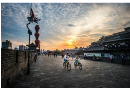
Muralla antigua de la ciudad

Luego, va a tomar el vuelo estimado HU7539 17:40-20:10 para llegar a Guilin Después de llegar a Guilin, será traslado al hotel y se va a hacer el check in.