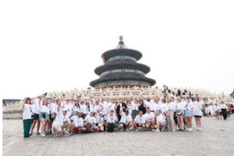
Templo del Cielo

Después de la llegada, su guía en Xi'an le trasladará al hotel.