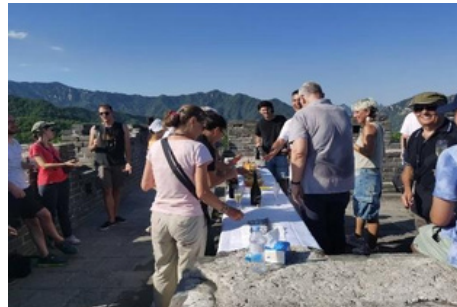
Coctel en la Muralla