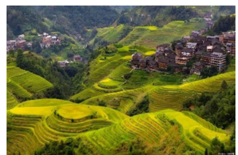
Ter razas de Arroz de Longji