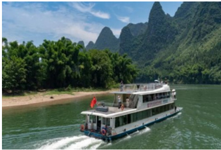
Crucero por el Río