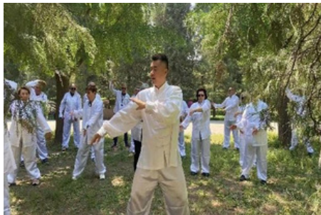
Clase de Tai Chi