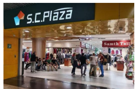
Plaza Comercial Asia Pacífica