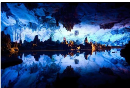
Cueva de la Flauta de Caña

Y luego va a tomar el vuelo estimado CZ095 17:30-19:55 para ir a Shanghái. Después de la llegada a Shanghái, será traslado al hotel para descansar.