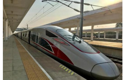
Tren de alta velocidad