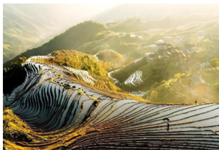
Terrazas de Arroz de Longji