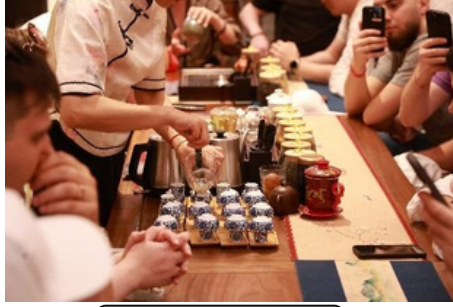
Ceremonia del Té