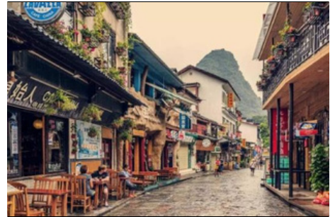
Calle del Oeste de Yangshuo