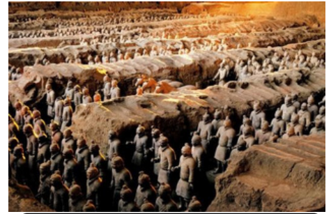
Guerreros y Caballos de Terracota