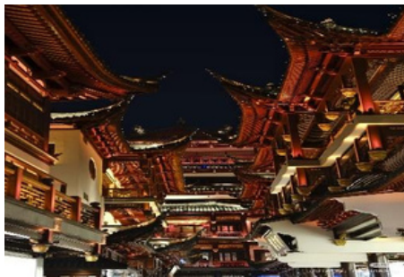
Calle Antigua del Jardín Yuyuan