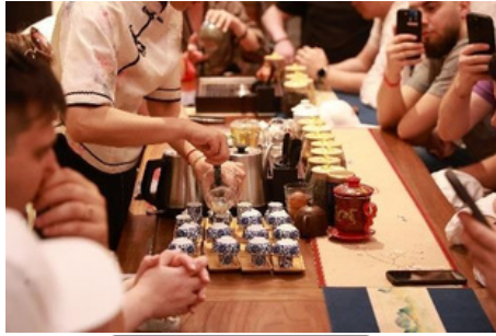
Ceremonia del Té