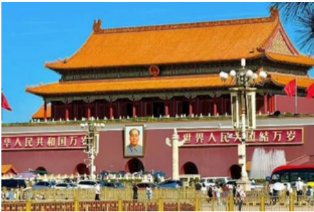
Plaza de Tian'anmen

Hoy va a visitar primero la Plaza de Tian'anmen , la plaza central más grande del mundo. No solo ha sido el testigo del ascenso y la caída de las dinastías, sino que también es un símbolo clave de la china moderna. Desde allí, puede entrar a la Ciudad Prohibida (cerrada todos los lunes) , cuya construcción duró 14 años, de 1406 hasta 1420, donde 24 emperadores gobernaron China durante unos 600 años. Tras almorzar en un restaurante local, se dirigirá al Palacio de Verano . En el año 1750, se inició la construcción del fastuoso jardín real para preparar la ceremonia de cumpleaños de la madre del emperador Qian long, y ahora es Patrimonio de la Humanidad de la UNESCO. Conocido por los impresionantes jardines y los serenos lagos, fue el destino favorito de los emperadores para pasar el verano. Terminará el día con una cena de bienvenida en el restaurante de pato asado de Pekín , saboreando el famoso manjar chino, que es conocido por su piel crujiente y su carne tierna. Servido con tortitas finas, salsa de judías dulce y verduras cortadas, es un plato imprescindible para cualquier visitante de la ciudad.