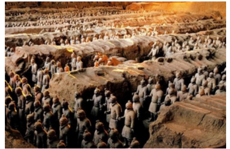
Guerreros y Caballos de Terracota