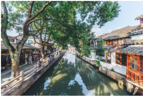
Pueblo Acuático de Zhujiajiao