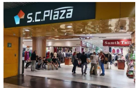
Plaza Comercial Asia Pacífica