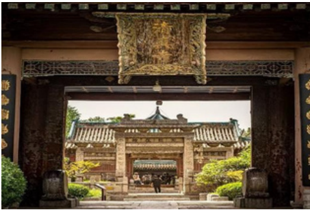
Gran Mezquita de Xi'an

La cena será un banquete de dumplings y después disfrutará de la música y la danza de la Dinastía Tang .