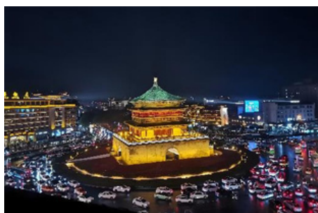
Muralla antigua de la ciudad