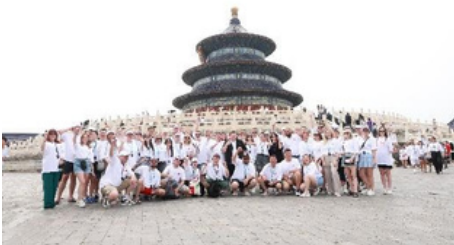
Templo del Cielo

Después del almuerzo, va a tomar el tren de alta velocidad estimado G57 14:05-18:30 de Pekín a Xi'an. Después de la llegada, su guía en Xi'an le trasladará al hotel.