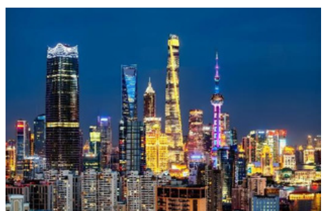
La ciudad de Shanghái