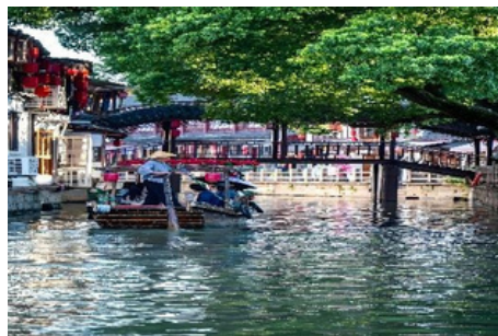
Pueblo Acuático de Zhujiajiao