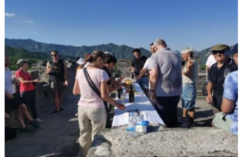
Coctel en la Muralla