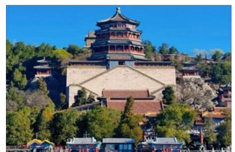
Palacio de Verano