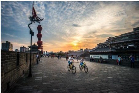
Muralla antigua de la ciudad

Hoy, se le llevará a visitar la Muralla Antigua de la Ciudad , fortificaciones de Xi'an, que ha existido por más de 600 años. Representa una de las murallas chinas más antiguas, grandes y mejor conservadas. Además, al estar en la muralla antigua, se quedará sorprendido por el contraste entre el pasado y el presente. Es interesante recorrer en bicicleta. Luego, va a tomar el vuelo estimado HO5576 14:00-16:25 para llegar a Shanghái. Después de llegar a Shanghái, será traslado al hotel y se va a hacer el check in