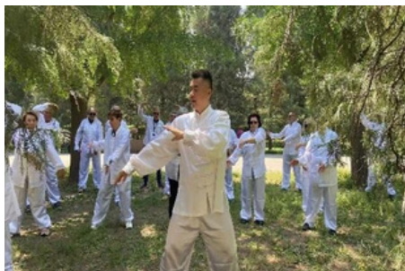
Clase de Tai Chi