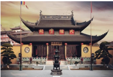
Templo del Buda de Jade

Luego, irá a Xintiandi . Se trata de una zona recreada surgida de la expansión de las viviendas Shikumen, símbolo arquitectónico de Shanghái en el siglo XX. Los edificios de Xintiandi conservan las paredes y tejas antiguas y al mismo tiempo, es un centro de entretenimiento repleto de bares y boutiques, discotecas que lo convierten en un buen lugar para experimentar la vida de nocturna de Shanghái. Xintiandi es diferente de los centros comerciales, donde ofrece a los diseñadores chinos una plataforma para comunicarse con los artistas internacionales de la clase mundial.