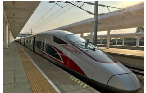
Tren de alta velocidad