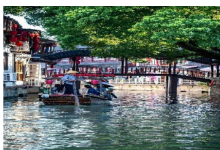
Pueblo Acuático de Zhujiajiao