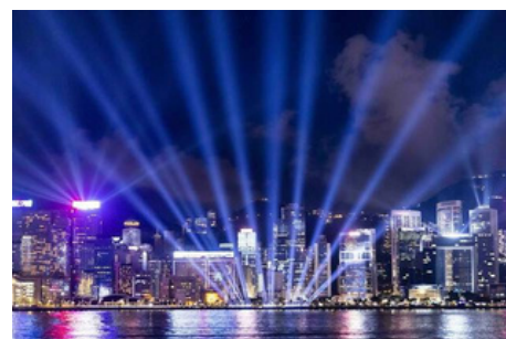
Espectáculo de luces