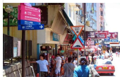
Mercado de Stanley