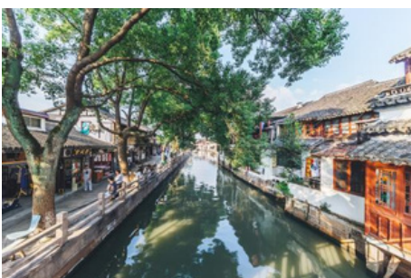
Pueblo Acuático de Zhujiajiao

Hoy, vamos a recorrer 54 kilómetros, aproximadamente 1,5 horas, para visitar la Pueblo Acuático de Zhujiajiao . Se trata de un pueblo acuático conocido en todo el país. Con una historia de más de 1700 años, este pequeño pueblo en forma de abanico es considerado la Venecia de Shanghái. Aquí podrá contemplar los puentes antiguos que cruzan arroyos burbujeantes, pequeños ríos sombreados por árboles y casas con patios. Todo atrae a los turistas que viven en la bulliciosa ciudad a un mundo completamente nuevo lleno de antigüedad, ocio y tranquilidad. Después le llevaremos a la Plaza Comercial Asia Pacífica , también conocida como A.P. Plaza, es un gran centro comercial subterráneo de Shanghai. Es un destino popular conocido por su variedad de artículos, como ropa, bolsos, relojes, telas, perlas y souvenirs. El mercado cuenta con 1.000 tiendas y se ha convertido en un mercado imperdible para los turistas internacionales. Después, le trasladaremos al hotel.