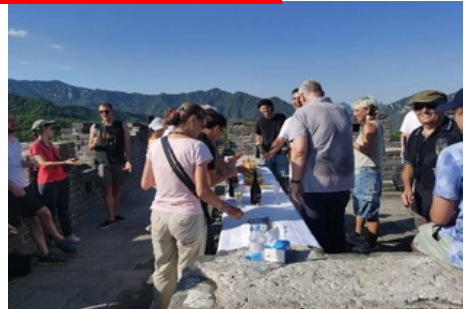
Coctel en la Muralla