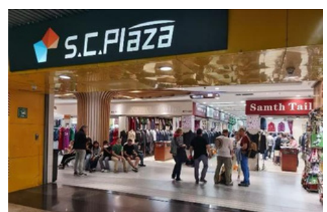
Plaza Comercial Asia Pacífica