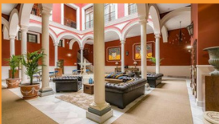
Hotel Vincci La Rabida, Sevilha