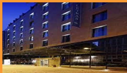
Hotel Eurostars das Letras, Lisboa