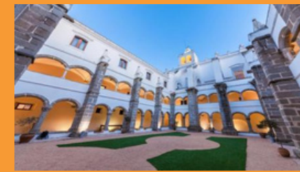
Convento do Espinheiro, Évora