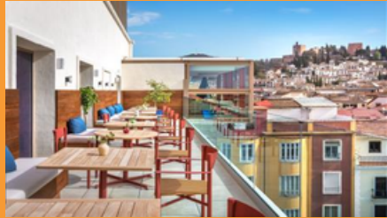
Hotel Melia Granada

Hoteles previstos o similares para Granada: