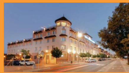
Hotel Hesperia, Córdoba