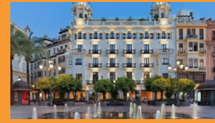
Hotel H10 Palacio Colomera, Córdoba