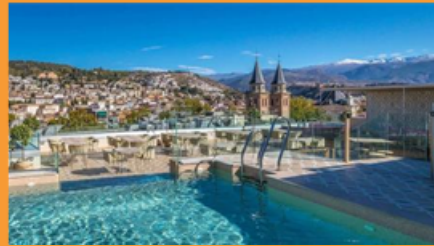
Hotel Barcelo Carmen Granada

Hoteles previstos o similares para Málaga: