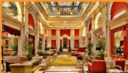
Hotel Avenida Palace, Lisboa