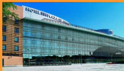
Hotel NH Plaza de Armas, Sevilha