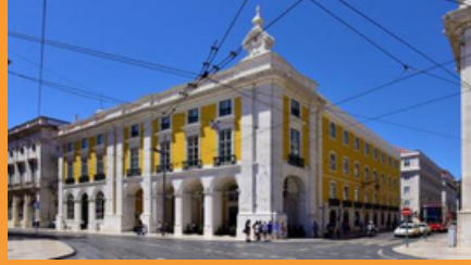
Pousada de Lisboa –Praça do Comércio