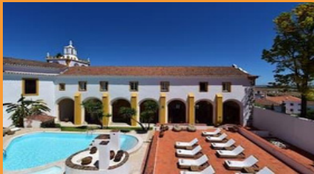
Pousada de Évora –Convento dos Lóios