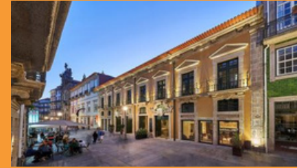
Pousada do Oporto–Rua das Flores