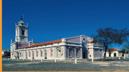
Pousada D. Maria I, Queluz