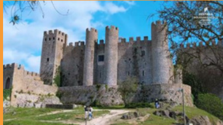
Pousada do Castelo de Óbidos