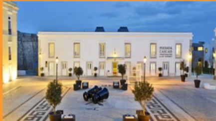
Pousada Cidadela de Cascais