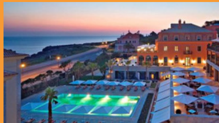
Grande Real Villaltália Hotel & Spa