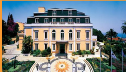
Olissippo Lapa Palace, Lisboa