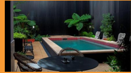
Valverde Hotel, Lisboa