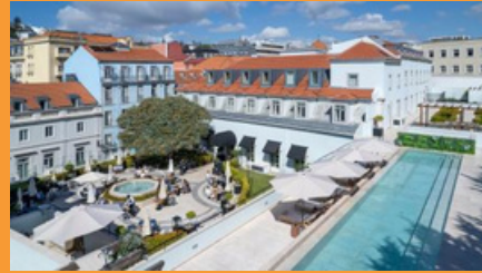
The One Palácio da Anunciada, Lisboa