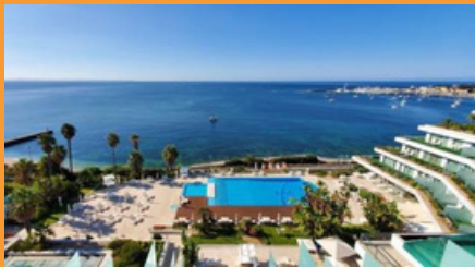
Hotel Cascais Miragem Health & Spa