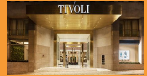
Tivoli Liberdade Hotel, Lisboa