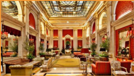
Hotel Avenida Palace, Lisboa