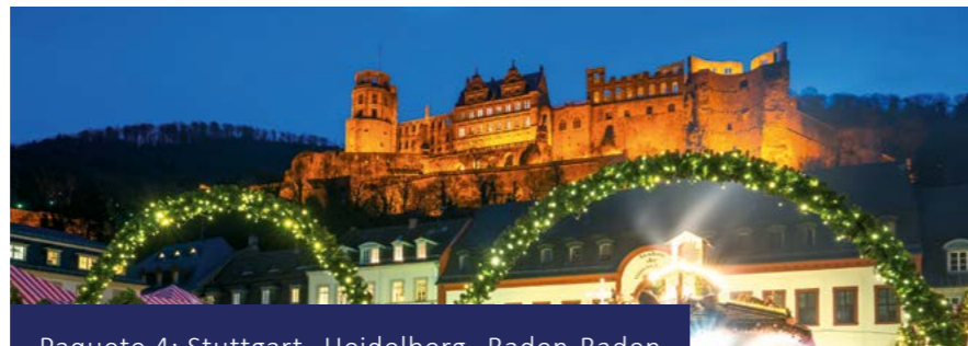
Paquete 4: Stuttgart - Heidelberg - Baden-Baden