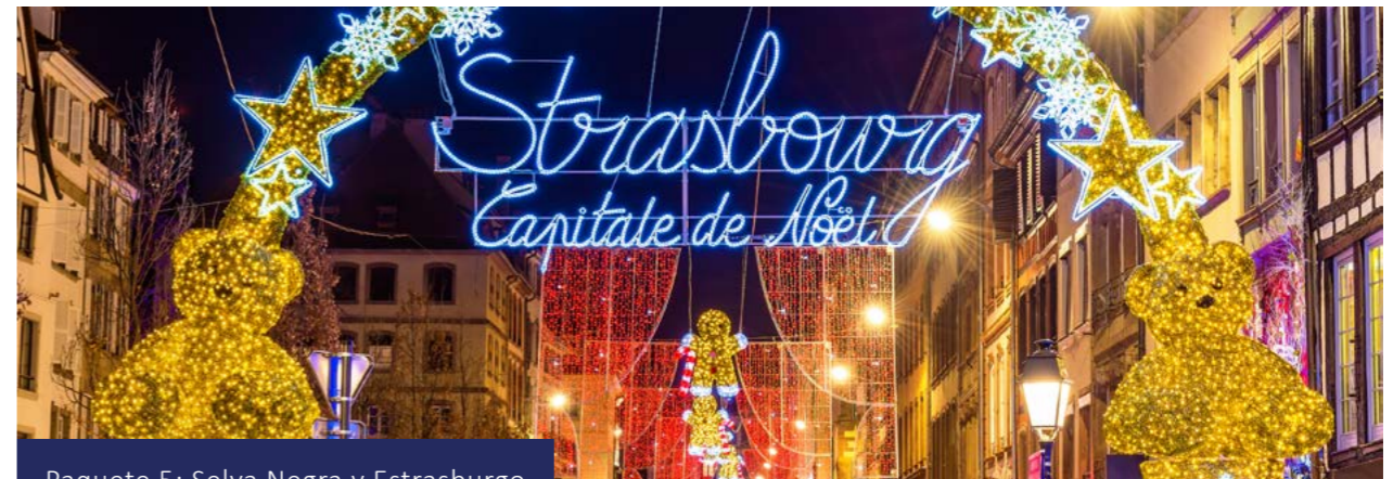
Paquete 5: Selva Negra y Estrasburgo

Si hay suficiente tiempo, puede visitar opcionalmente el mercado de Navidad en Esslingen, famoso por ofrecer un ambiente medieval muy especial. Traslado privado opcional al aeropuerto.