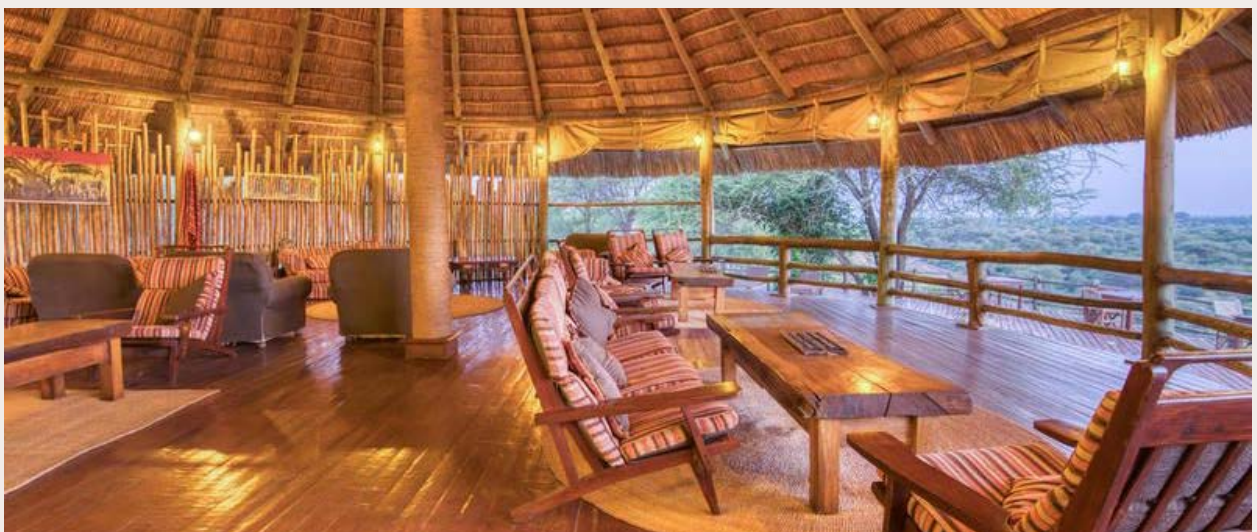
PN TARANGIRE, TARANGIRE RIVER CAMP