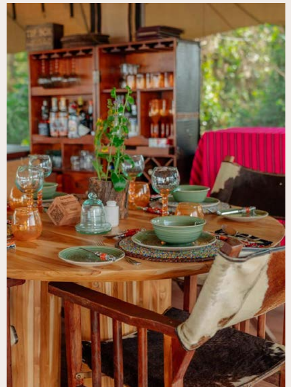
NGORONGORO, PAKULALA SAFARI CAMP