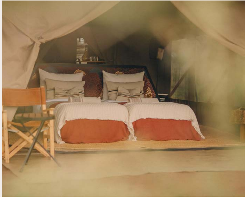
SERENGETI, PUMZIKA LUXURY SAFARI