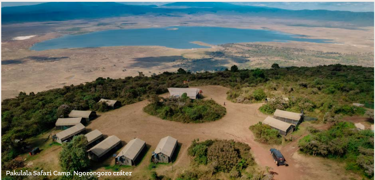
Pakulala Safari Camp. Ngorongoro cráter

La 8 o maravilla del Mundo, declarado Patrimonio de la Humanidad por la UNESCO, un antiguo volcán de 6.500 metros, que erupcionó hace millones de años, dejando una de las calderas más grandes de mundo. Lleno de fauna, que inspiró a los realizadores de la película de animación “El Rey León”, es el final perfecto para un safari, antes de emprender camino hacia las playas de Zanzíbar.