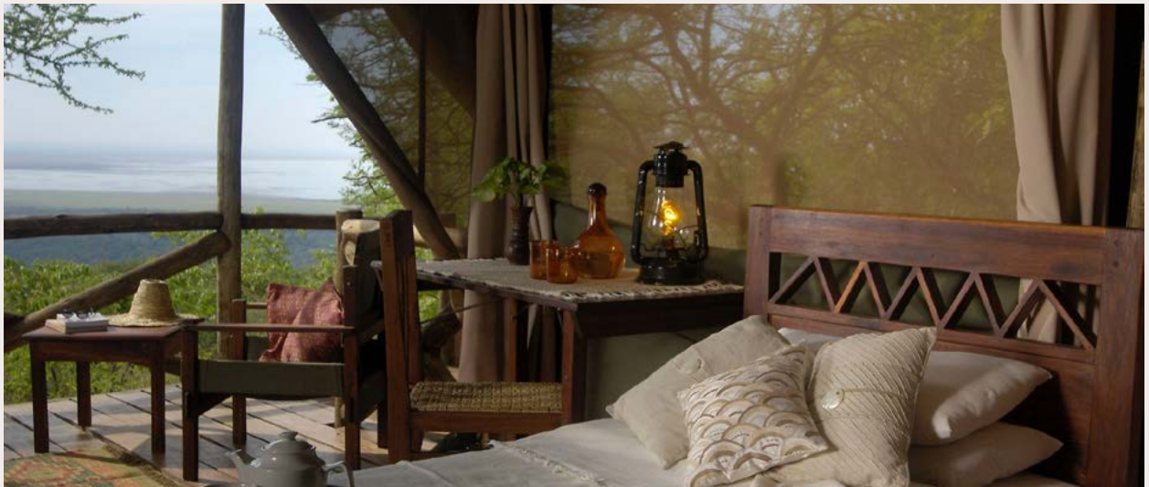
KIRURUMU MANYARA LODGE