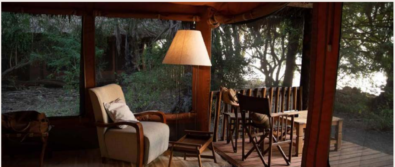
LAKE EYASI, KISIMA NGEDA TENTED CAMP