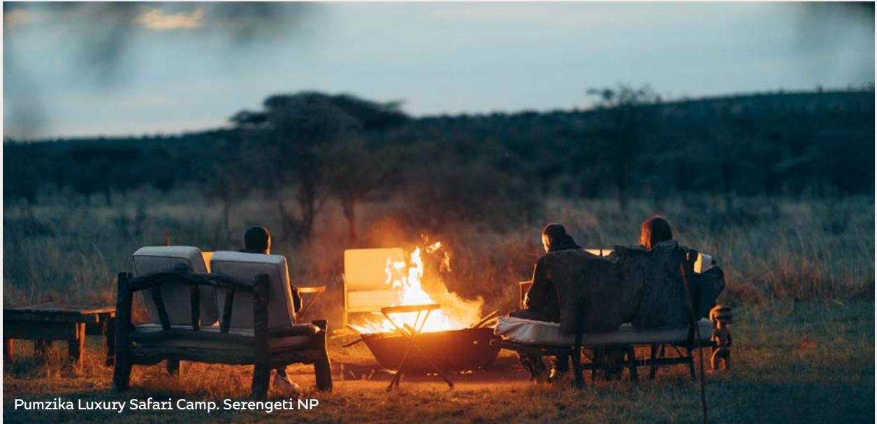
Pumzika Luxury Safari Camp. Serengeti NP