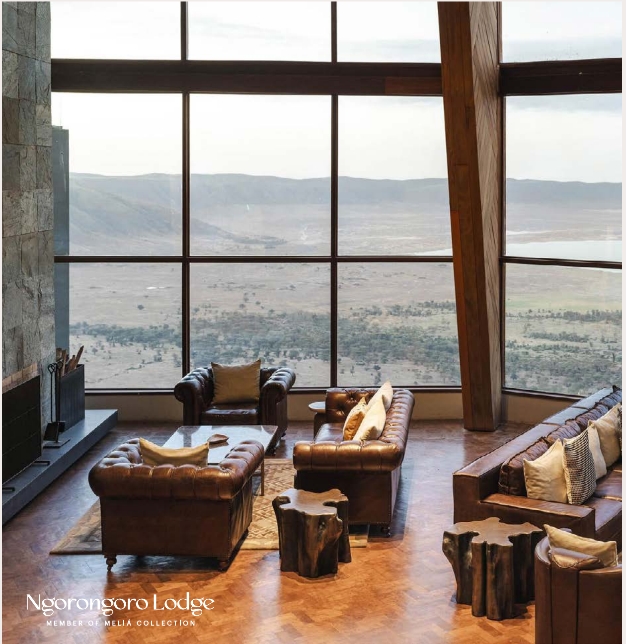
Ngorongoro Lodge MEMBER OF MELIA COLLECTION