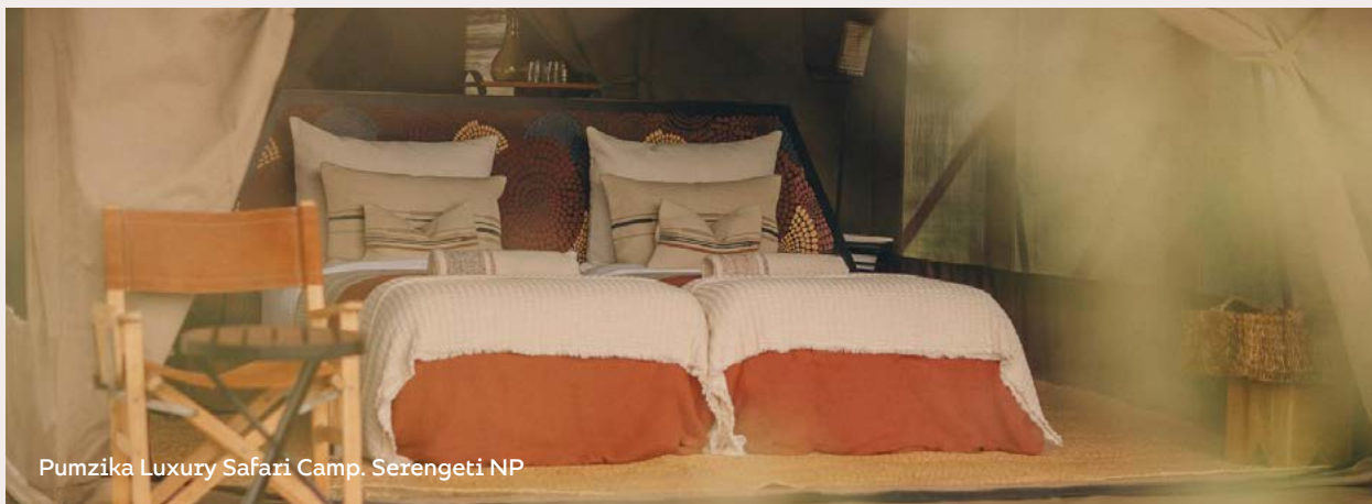
Pumzika Luxury Safari Camp. Serengeti NP