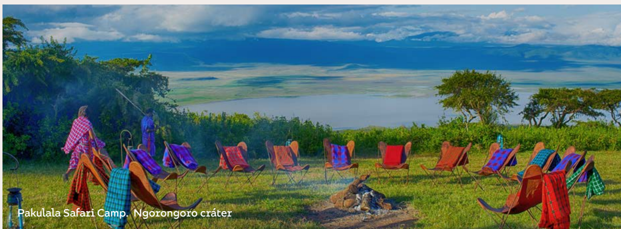
Pakulala Safari Camp. Ngorongoro cráter

rollando nuestra filosofía sostenible y responsable focalizada en la directa repercusión en la economía local de la vida masai que habita el cráter en convivencia y respeto con la fauna y flora que allí habita. Cada viajero Ratpanat que se aloja en PAKULALA SAFARI CAMP ( www.eastafricacamps.com ) contribuye directamente en esta simbiosis mágica que se produce entre el turismo, la vida masai y la fauna y sus safaris, de la que nos sentimos muy orgullosos.