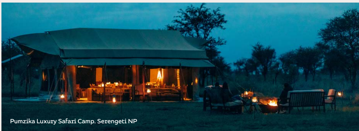
Pumzika Luxury Safari Camp. Serengeti NP