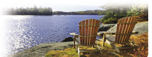
Muskoka Chairs sobre el lago de los Dos Ríos, Parque Provincial de Algonquin

Día 11 > Hoy recorreremos aproximadamente 40 millas (64,36 km) hasta nuestra sucursal de Cruise Canada en Bolton. Merece la pena extender nuestra estancia en Toronto y explorar la ciudad al máximo. ★ EdgeWalk, a 356m de altura, la plataforma que rodea el perímetro superior de la Torre CN, ofrece unas vistas espectaculares.