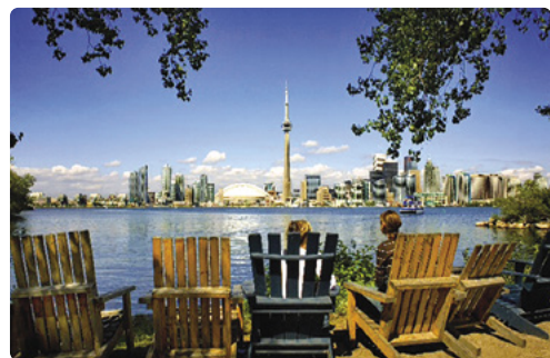
Vista de la Torre CN y el Centro Rogers desde la Isla de Toronto Island

Días 3/4 > Hoy viajaremos hasta Blue Mountain, la montaña azul. Hoy haremos noche en el complejo turístico de Wasaga Pines Resort, en la escarpada costa de Georgian Bay. Wasaga Beach es la playa de agua dulce más larga del mundo y el complejo se encuentra a escasos minutos, así que conviene llevar ropa de baño. En las cristalinas aguas de Georgian Bay se puede practicar multitud de actividades acuáticas, desde kayaking hasta bucear entre restos de naufragios. No estamos lejos del pueblo peatonal de Blue Mountain Resort. 📍 160 millas (257,44 km) hasta Wasaga Pines Resort ★ Visitar Blue Mountain Resort, para disfrutar de una amplia gama de actividades al aire libre, como Ridge Runner Mountain Coaster, Scenic Caves Nature Adventures, paseos en bicicleta y golf. 🌐 https://goo.gl/YG1GgJ