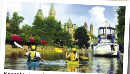
Ruta en kayak por el canal Rideau, Ottawa

secundarias, sus restaurantes de carretera, productores de comida artesanal y bodegas vinícolas. También ofrece una de las mejores playas de Canadá, la del Parque Provincial de Sandbanks. 🌐 www.koa.com/campgrounds/toronto-west