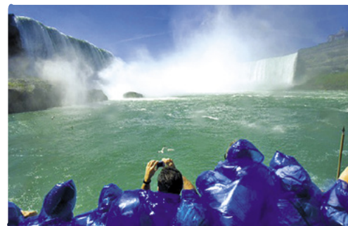
Cataratas del Niágara

Días 7/8 > Hoy viajaremos al este, con rumbo a la vibrante ciudad de Ottawa, la capital federal de Canadá. De camino, podemos parar para disfrutar de una sesión de descenso de aguas bravas en Forester's Falls. En Ottawa, haremos noche en el camping de Popular Grove, 30 minutos al suroeste de Ottawa, para relajarnos después de un día largo de carretera. Necesitaremos un día entero para explorar esta hermosa ciudad, que alberga una gran cantidad de sitios culturales e históricos, galerías y museos. Merece la pena disfrutar de un recorrido en barco, a pie o en bicicleta por el canal Rideau, uno de los puntos neurálgicos de la ciudad, y declarado Patrimonio Histórico de la Humanidad por la UNESCO. Pasearemos por el mercado ByWard, en el centro de Ottawa, para saborear las vistas, los sonidos y los olores de uno de los mercadillos de productos locales más grandes y antiguos de Norteamérica. 📍 200 millas (321,8 km) hasta el camping de Popular Grove ★ En esta increíble ciudad de museos y galerías, no podemos perdernos el Museo Canadiense de la Civilización, la Galería Nacional de Canadá, el Museo Canadiense de la Naturaleza, la Fábrica de Moneda Real de Canadá y más. 🌐 www.ottawaspoplartrovecamp.com