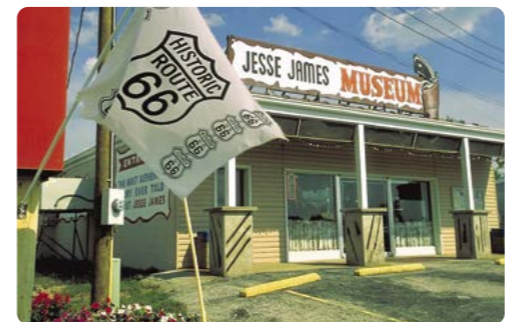
Museo Jesse James, Stanton, Missouri

Días 12/13 > Disfrutar de la ciudad que nunca duerme - ¡Las Vegas! El camping cerca de Circus Circus está en la misma calle principal de las Vegas, Las Vegas Strip donde se encuentran atracciones tan famosas como las recreaciones de Nueva York y París. 100 millas (160,9 km) ★ Pasar el día paseando por la avenida principal y disfrutar de alguno de los muchos espectáculos y funciones que ofrece la ciudad. Cualquiera de los del Circo del Sol será estupendo. Si se dispone de tiempo suficiente, pasar por la calle Fremont para disfrutar de los artistas callejeros y un espectáculo de luces fascinante. ¡No se olvide de dar propinas! Amplíe su viaje unas cuantas noches para visitar los cañones de Zion y Bryce y los Parques Nacionales de Utah. https://goo.gl/4LRExc