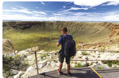
Cráter Barringer, Flagstaff

Día 21 > Si tenemos tiempo suficiente, quedarnos un poco más de tiempo y dirigimos hacia Yosemite. Si nuestro tiempo es limitado, merece la pena disfrutar de una de las excursiones de un día en Yosemite. Tras el desayuno, tomar rumbo hacia la cursal de Cruise America en Newark, cerca de San Francisco para devolver nuestro hogar rodante.