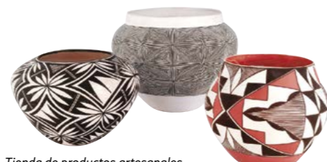
Tienda de productos artesanales auténticos de los indios americanos

Día 6 > Hoy nos espera un largo trayecto con dirección a Amarillo, en Texas. Pero hay mucho que ver y hacer, así que merecerá la pena. Visitaremos el Parque Estatal del Cañón de "Palo Duro", con más de 20.000 acres (8093 Has) el segundo de mayor extensión de los EEUU, habitado en su día por indios de las tribus Apache, Cheyenne y Comanche. 325 millas (522,9 km) ★ Experimentar el cañón de Palo Duro en primera persona, como hicieron los vaqueros en su día: a lomos de un caballo. De camino hacia el rancho Cadillac, coger botes de