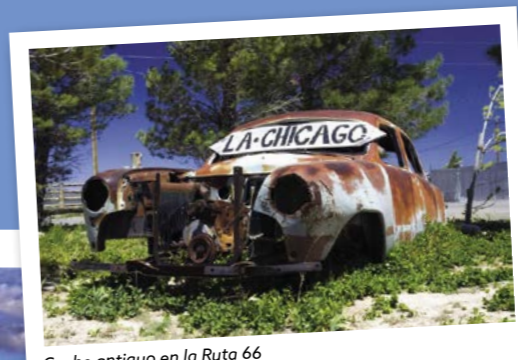
Coche antiguo en la Ruta 66