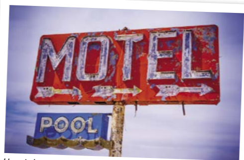
Una de las muchas señales de neón de la Ruta 66

Días 9/10 > Hoy tenemos un largo recorrido por delante hasta el camping KOA de Williams, el portal hacia el Gran Cañón donde pasaremos dos noches. De camino, pararemos en Gallup, para algunos, la Capital India del Mundo por su ubicación en el centro de antiguos dominios de los nativos americanos. Desde el camping KOA de Williams, tenemos tres opciones para visitar el Gran Cañón. Llevar la autocaravana para disfrutar de todas las comodidades que nos ofrece, unirnos al tour en furgoneta de KOA o llegar en tren por el ferrocarril del Gran Cañón. 360 millas (579,24 km) ★ Si se tiene oportunidad, reservar un tour en