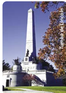
Tumba de Lincoln

Día 1 > Tras uno o dos días conociendo la ciudad del viento (Chicago, the Windy City), nos acercaremos a la oficina de alquiler de Cruise América para recoger nuestra autocaravana y partir rumbo a Springfield, en el estado de Illinois, y adentrarnos en el medio oeste de los EEUU. Bienvenido a la Ruta 66 - disfrutaremos del museo, las tiendas y quizás una cena en un típico diner Americano. 200 millas (321,8 km) ★ Visitar la tumba de Lincoln y el Sitio Estatal Histórico de Salem, una reconstrucción de un pueblo de 1830 donde Abraham Lincoln pasó parte de su juventud. www.koa.com/campgrounds/springfield/