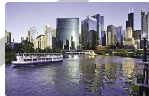
Río Chicago y Torre Willis

Día 3 > Hoy nos dirigiremos hacia el corazón de los EEUU y Tulsa. Pararemos en Joplin, en su día escondite de Bonnie & Clyde, la famosa la pareja de forajidos La vibrante Tulsa, en su día conocida como la 'capital petrolífera del mundo' hoy acoge una de las mayores colecciones de arte y