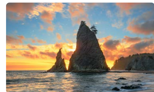
Playa de Rialto, Parque Nacional Olímpico

Día 3 > Pase el día siguiente explorando la península occidental península ara aquellos que estén familiarizados con la serie Crepúsculo, hagan una parada en el pueblo de Forks, que fue el principal escenario utilizado para las películas y los libros. Pase la noche en la naturaleza del Valle de Quinault. 123 millas hasta el lago Quinault ★ Reservar una