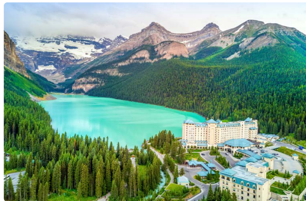
Lago Louise, Parque Nacional de Banff

edificios de los pioneros y otros artefactos históricos. Tome una copa en la primera taberna legal del estado, en Winthrop. Visitar el Centro del Desierto. http://www.campokanagan.com/