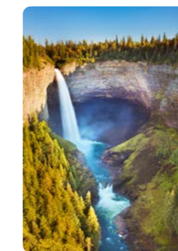
Cascadas Helmcken, Parque Provincial Wells Gray