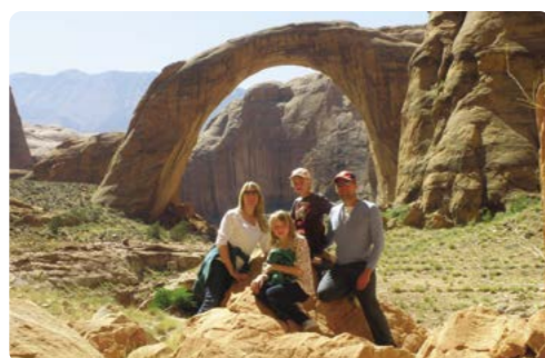
Monumento Nacional del Puente Del Arcoiris

Día 1/2 > Recogemos nuestra autocaravana en la sucursal de Cruise America en Las Vegas, para dirigirnos al Parque Nacional de Zion, donde nos espera una experiencia única. Cañones con paredes verticales que ascienden hasta fundirse con el azul del cielo. Como mejor se ve Zion es paseando bajo estos gigantes precipicios y atravesando sus estrechos cañones. Las paredes de estos singulares acantilados están teñidas por una inusual paleta de colores, que va desde el crema, al rosa, pasando por el rojo. Se les puede describir como castillos de arena coronando cañones desérticos. El complejo turístico Zion River Resort goza de una ubicación excepcional que garantiza el fácil acceso al que es uno de los parques más hermosos de la región, así que igual nos merece la pena pasar más de una noche. También merece la pena conocer Springdale, un pueblo encantador en la antesala del Parque Nacional de Zion. 147 millas (236,5 km) hasta Zion River Resort ★ Hay mucho que ver hacer y disfrutar en Zion. Desde senderismo por sus desfiladeros o el camino de Los Angeles, hasta un paseo en burro para dejarse embriagar por los paisajes. Se puede completar el día con una visita al Teatro del cañón Zion. www.zionriverresort.com