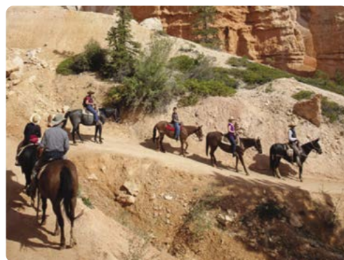
Ruta a caballo en el cañón Bryce

Día 5/6 > Hoy nos dirigiremos hacia el este para ver otras zonas del Parque Nacional del Gran Cañón y a través del Bosque Nacional (National Forest) de Kaibab, para tomar rumbo hacia la ciudad de Page y al fabuloso Lake Powell en el río Colorado. En el lago podemos disfrutar de una gran variedad de actividades. Podemos alquilar una lancha o apuntarnos a una de las excursiones que parten desde el complejo turístico de Lake Powell para visitar el monumento del Rainbow Bridge y explorar la zona. El camping de Wahweap está ubicado en las orillas del lago y en él podremos disfrutar de la piscina y otras instalaciones del resort. 145 millas (233,3 km) hasta Lake Powell ★ Alquilar una