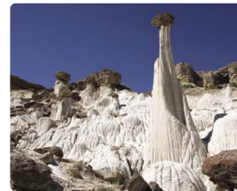
Monumento Nacional de Wahweap Hoodoos, Grand Staircase, Escalante

Día 12 > Nos tomaremos el tiempo necesario para explorar el Parque Nacional de Arches, donde se conservan 2.000 arcos de arenisca, incluido el famoso Arco Delicado (Delicate Arch). La naturaleza ha cincelado un paisaje único de contrastes cromáticos, de formas y texturas con la mayor densidad de arcos naturales del mundo. Seguiremos con nuestro viaje hacia el Parque