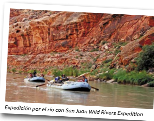
Expedición por el río con San Juan Wild Rivers Expedition

Arizona en el suroeste. Mesa Verde, ofrece la posibilidad de conocer cómo vivía el Pueblo Ancestral, los ocupantes de esta zona durante 700 años. Hoy el parque ofrece protección a casi 5.000 yacimientos arqueológicos, incluidas 600 viviendas en acantilados. Estos yacimientos son algunos de los más notables y mejor conservados de los EEUU. 87 millas (139,9 km) hasta Mesa Verde ★ Reservar una visita guiada a los famosos poblados de Cliff Palace y Balcony House, que sólo pueden visitarse formando en grupos guiados por un guarda o vigilante forestal. http://www.mesaverdervesort.com/