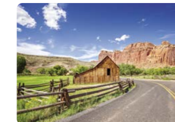
Establo Gifford, Parque Nacional Capitol Reef