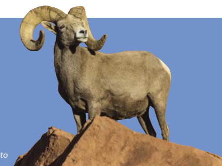
Carnero del desierto