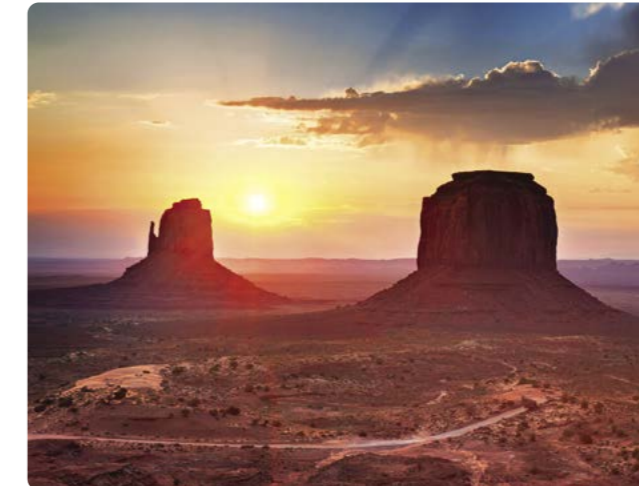
Valle de los Monumentos

Días 10/11 > Hoy nos dirigiremos hacia Moab, y de camino visitaremos Hole N' the Rock, el agujero en la roca, una vivienda histórica única de 5000 pies cuadrados excavada en una gran roca en Canyonlands Country (el País de las Tierras de los Cañones). Desde Moab, visitaremos el Parque Nacional de Canyonlands y el centro para visitas Islands in the Sky (Islas en el Cielo). El altiplano de la Isla en el Cielo se eleva a 1.000 pies ( m) por encima de los acantilados calizos que lo rodean. Se mire por donde se mire, esta formación ofrece unas vistas inmejorables del espectacular paisaje de la tierra de los cañones. La visita a la Isla es cómoda y no lleva mucho tiempo. Moab también es una meca para los aficionados a actividades al aire libre y el centro de aventuras de Moab, ofrece la manera más fácil para practicar distintas actividades al aire libre - desde un tour en lancha de medio día de duración en el río Colorado, hasta un descenso de rápidos, para los más intrépidos. También podremos apuntarnos a disfrutar de una ruta en 4x4 de medio día para redondear la jornada. Después podremos relajarnos con una cena o un espectáculo de luz y sonido en cualquiera de las embarcaciones que los ofrecen. 125 millas (201,1 km) hasta Moab ★ Visitar Hole N' The Rock, el Parque Nacional de Canyonlands o cualquier tipo de actividad de aventuras de Moab. https://goo.gl/GVEBHD