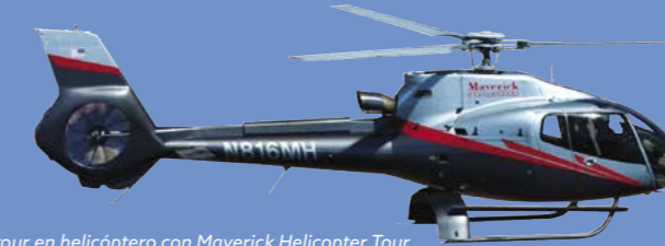
Vistas desde un tour en helicóptero con Maverick Helicopter Tour

de rápidos, pasando por paseos en bici, barca mula y a pie, picnics y mirar a las estrellas.