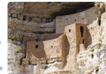
Poblados en acantilados, Parque Nacional Mesa Verde

Nacional de Capitol Reef, y haremos noche aquí, en el camping de Fruita. 147 millas (236,5 km) hasta el Parque Nacional de Capitol Reef ★ Explorar los arcos Delicate (Delicado), Double (Doble) y Landscape (Paisaje) y quizás el sendero de Devils Garden (el Jardín del Diablo) o el de Balanced Rock (la Piedra en Equilibrio) en Arches. Visitar la casa museo de Gifford cerca del camping de Capitol Reef NP antes de partir. https://goo.gl/7dSsLL