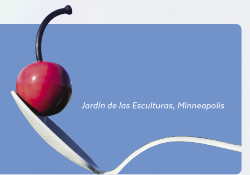
Jardín de las Esculturas, Minneapolis

A Minnesota se le conoce por el sobrenombre de "Land of 10,000 Lakes" Con 85.000 millas (1367 km) de costa, 66 Parques Estatales, 57 bosques estatales y 2 Bosques Nacionales, este tour está especialmente recomendado para aquellos que quieran disfrutar de la naturaleza y de la abundante fauna de esta zona y sus santuarios de águilas, lobos y osos negros, mundialmente reconocidos.