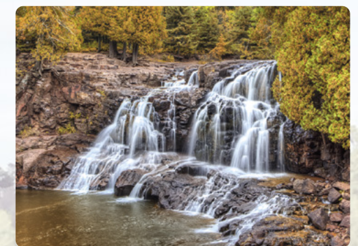
Cataratas Gooseberry, orilla norte, Lago Superior

vacacional con pista de golf, el Old Barn Resort & River's Bend, en Lanesboro, un pueblo encantador. W www.barnresort.com