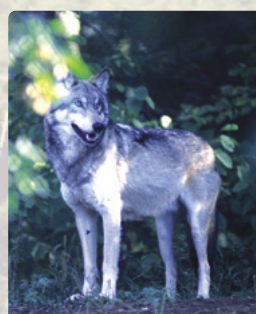
Centro de Observación de Lobos, Ely