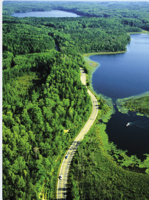
Carretera panorámica Edge of the Wilderness (Borde de las Tierras Salvajes)

Día 4 > Hoy conduciremos hasta Ely, nombrado el pueblo más 'cool' de los EEUU por la revista Budget Travel. Visitar el Centro del Oso de Norteamérica para conocer los pormenores de la vida de los osos negros que viven en los bosques del norte de Minnesota. También en Ely podremos visitar el Centro Internacional del Lobo, donde podremos observar la manada de lobos que vive en sus instalaciones y participar en distintos programas educativos. 210 millas (337,89 km)