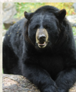
Centro de Observación de Osos de Norteamérica, Ely