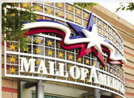
The Mall of America

Día 10 > Hoy nos madrugaremos para recorrer las 125 millas (201,1 km) que nos separan de la sucursal de Cruise America en Minneapolis, salvo que hayamos reservado la opción Earlybird Departure Special, en cuyo caso tendremos hasta las 15.00 de la tarde.