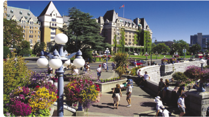
Hotel Fairmont Empress, bahía interior, Victoria

Telegraph Cove. Nuestro camping para autocaravana permanece abierto todo el año, y ofrece todo tipo de comodidades, vistas al mar y un puerto deportivo. 195 millas (313,7 km) hasta Telegraph Cove, incluido el viaje de ida y vuelta hacia Port Hardy, al norte ★ Visitar el Parque Provincial de Cormorant Channel de camino al camping.