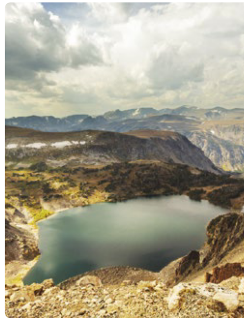
La montaña del Trueno (Thunder Mountain) desde la carretera eartooth, Montana

Días 5/6 > Merece la pena pasar la mañana en la carretera para desviarnos hacia Medora en Dakota del Norte. Probablemente si no hubiera sido por su pasado como rancharo en el estado, Theodore Roosevelt nunca se hubiera lanzado a crear el Servicio de Parques Nacionales. Visitaremos el Parque Nacional que lleva su nombre, atentos para avistar cualquier bisonte, caballo salvaje, alce o águila dorada durante nuestro recorrido. 📍 250 millas (402,25 km) fáciles hasta Medora ★ Disfrutar de una noche al aire libre con una actuación en el anfiteatro de Medora Musical y una cena en la Pitchfork Fondue (Founde del Tridente) en los meses de verano, con los paisajes abarrancados de Dakota del Norte como telón de fondo. 🌐 https://goo.gl/XmYHVK para una ubicación realmente rústica https://goo.gl/Gkr2VK con algunas instalaciones más.