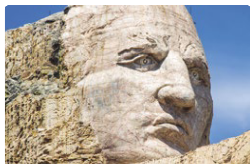
Monumento a Caballo Loco

Día 2 > Tomamos rumbo hacia a las Black Hills (Colinas Negras) en Dakota del Sur. Se trata de un trayecto relativamente extenso, pero que merece la pena. En las Black Hills se encuentran algunas de las atracciones más icónicas de los EEUU, por no hablar de sus carreteras secundarias y las vistas que esperan en cada vuelta, formaciones rocosas y colinas boscosas. 📍 240 millas (386,16 km) hasta Hot Springs ★ Visitar el Parque Nacional de Wind Cave (Cueva del Viento) o el yacimiento paleontológico activo de Mammoth Site (el Yacimiento de Mamuts). 🌐 www.nps.gov/wica/planyourvisit/campgrounds.htm