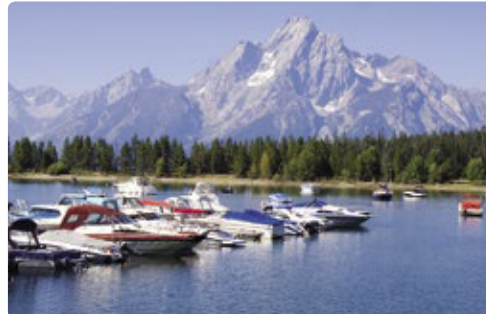
Bahía Colter, Parque Nacional Grand Teton

Días 13/14 > A una escasa distancia de la entrada sur del Parque Nacional de Yellowstone se encuentra el Parque Nacional de Grand Teton, dominado por los majestuosos Tetons, una estribación de las famosas Montañas Rocosas. En los confines del parque, el 'oeste cosmopolita' de Jackson nos recibe con sus aceras de madera, arcos de cornamentas de alces y tiendas que van desde lo más moderno a lo tradicional. 40 millas (64,36 km) hasta el camping Colter Bay Village RV Park ★ Recorrer las 42 millas (67,5 km) (67,5 km) de la ruta panorámica a través del parque para dejarnos cautivar por una sucesión de maravillosas vistas. Al final del día, pasarnos por el bar Jackson's Million Dollar Cowboy – las banquetas están hechas con sillas de montar auténticas. 📍 http://www.gtcl.com/rv/colter-bay-rv-park