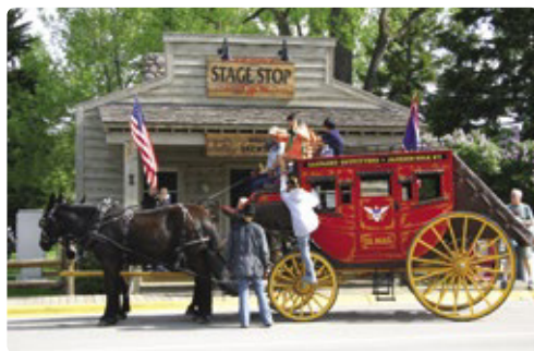
Cogiendo la diligencia, Jackson

📍 http://www.yellowstonenationalparklodges.com/lodging/camping/fishing-bridge-rv-park/