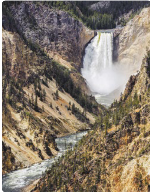
Cataratas Lower, Parque Nacional Yellowstone

Días 10/11/12 > Dedicaremos al menos dos días para disfrutar de los mágicos paisajes del Parque Nacional de Yellowstone. Desde Cody, nos dirigiremos hacia Red Lodge, al norte, para incorporarnos a la autovía Beartooth (Colmillo de Oso) – un impresionante pase montañoso hacia el parque. Nos espera una colección de géiseres, aguas termales y ciénagas de barro burbujeante, en una de las áreas de mayor actividad geotérmica del planeta. Casi con toda seguridad nos encontraremos con algún atasco, ocasionado por los animales cruzando la carretera o pastando en la cuneta de la autovía. Podría ser un bisonte, un alce, un coyote o incluso un oso grizzli. Sea lo que sea, seguro que merecerá la pena fotografiarlo. 400 millas (321,8 km) hasta Grant Village ★ Old Faithful uno de los géiseres más fiables, que entra en erupción cada 90 minutos, aproximadamente. Las cascadas Lower Falls del Gran Cañón de Yellowstone duplican en altura a las Cataratas del Niágara.