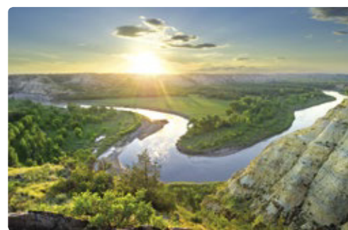
Parque Nacional Theodore Roosevelt

Día 4 > Es hora de bailar con lobos y tener un encuentro en la tercera fase. En este recorrido de gran belleza, atravesaremos el cañón Spearfish, donde Kevin Costner rodó la escena invernal de Bailando con Lobos, y se enamoró de la ciudad de Deadwood, hasta tal punto que ahora es propietario de muchos casinos en el casco histórico. Hoy haremos noche en Devil's Tower, la torre del diablo, donde se rodó Encuentros en la Tercera Fase. 📍 190 millas (305,71 km) hasta Devil's Tower por el cañón de Spearfish ★ Parada en Rapid City, la ciudad de los Presidentes, donde se puede disfrutar de una atmósfera animada y visitar el Journey Museum, el museo del viaje. 🌐 https://goo.gl/Xsz6dY