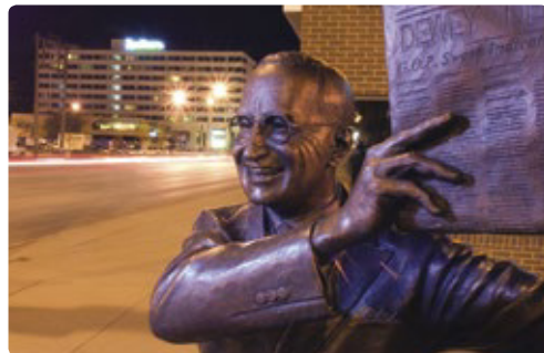
Rapid City, la ciudad de los Presidentes

Día 3 > Hoy nos vamos a encontrar cara a cara con los bustos de los presidentes Washington, Jefferson, Roosevelt y Lincoln en el Monumento Nacional de Mount Rushmore. Menos conocido, pero a poca distancia se encuentra el monumento de Crazy Horse (Caballo Loco), en honor al guerrero nativo americano. Se trata de un trabajo en curso, pero, una vez concluido, tendrá una altura de 171 metros y 195 metros de longitud. 📍 150 millas (241,35 km) hasta el parque nacional de Badlands pasando por el monte Rushmore ★ Tomar la Iron Mountain Road (Carretera de Montaña del Hierro) y la autovía de Needles (Agujas) para disfrutar de unas vistas espectaculares. Finalizar el día con una puesta de sol sobre las mesetas, barrancos y cañones del Parque Nacional de Badlands. 🌐 https://foreverresorts.rzda.net/cedarpass/