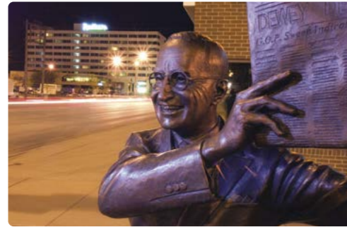
Rapid City, la ciudad de los Presidentes

Día 1 > Recogemos nuestra autocaravana antes de partir hacia el salvaje oeste en la capital del estado de Wyoming, Cheyenne. Pararemos en el rancho de bisontes Terry, donde más de 2,300 bisontes pastan pacíficamente o visitaremos el Capitolio Estatal y el Museo Estatal. 110 millas (176,99 km) hasta Cheyenne, Wyoming ★ Si tiene pensado viajar a finales de julio, asegúrese de reservar la plaza para su autocaravana con suficiente antelación, puesto que cada año Cheyenne celebra el festival Cheyenne Frontier Days, que incluye el mayor rodeo al aire libre del mundo. ¡El camping ofrece tortitas (pancakes) gratis para desayunar! www.campcheyenne.com