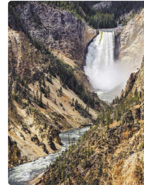
Cataratas Lower, Parque Nacional Yellowstone

Días 10/11/12 > Dedicaremos al menos dos días para disfrutar de los mágicos paisajes del Parque Nacional de Yellowstone. Desde Cody, nos dirigiremos hacia Red Lodge, al norte, para incorporarnos a la autovía Beartooth (Colmillo de Oso) – un impresionante pase montañoso hacia el parque. Nos espera una colección de géiseres, aguas termales y ciénagas de barro burbujeante, en una de las áreas de mayor actividad geotérmica del planeta. Casi con toda seguridad nos encontraremos con algún atasco, ocasionado por los animales cruzando la carretera o pastando en la cuneta de la autovía. Podría ser un bison, un alce, un coyote o incluso un oso grizzli. Sea lo que sea, seguro que merecerá la pena fotografiarlo. 200 millas (321,8 km) hasta Grant Village ★ Old Faithful uno de los géiseres más fiables, que entra en erupción cada 90 minutos, aproximadamente. Las cascadas Lower Falls del Gran Cañón de Yellowstone duplican en altura a las Cataratas del Niágara. http://www.yellowstonenationalparklodges.com/lodging/camping/fishing-bridge-rv-park/