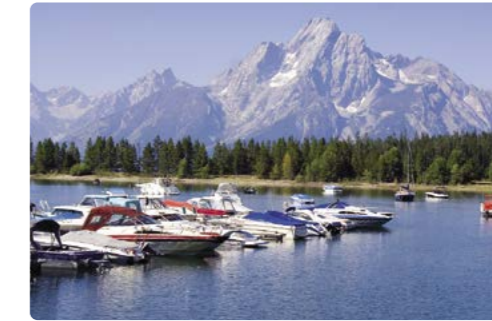
Bahía Colter, Parque Nacional Grand Teton

Días 13/14 > A una escasa distancia de la entrada sur del Parque Nacional de Yellowstone se encuentra el Parque Nacional de Grand Teton, dominado por los majestuosos Tetons, una estribación de las famosas Montañas Rocosas. En los confines del parque, el 'oeste cosmopolita' de Jackson nos recibe con sus aceras de madera, arcos de cornamentas de alces y tiendas que van desde lo más moderno a lo tradicional. 40 millas (64,36 km) hasta el camping Colter Bay Village RV Park ★ Recorrer las 42 millas (67,5 km) (67,5 km) de la ruta panorámica a través del parque para dejarnos cautivar por una sucesión de maravillosas vistas. Al final del día, pasarnos por el bar Jackson's Million Dollar Cowboy – las banquetas están hechas con sillas de montar auténticas. http://www.gtcl.com/rv/colter-bay-rv-park