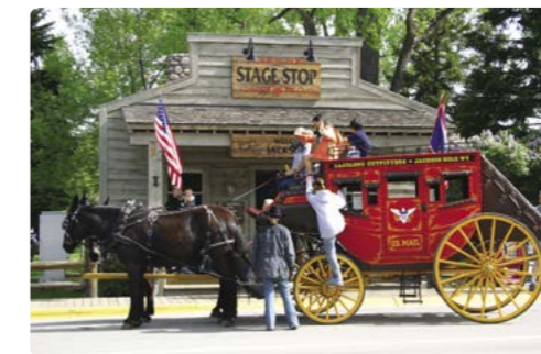
Cogiendo la diligencia, Jackson

Días 10/11/12 > Dedicaremos al menos dos días para disfrutar de los mágicos paisajes del Parque Nacional de Yellowstone. Desde Cody, nos dirigiremos hacia Red Lodge, al norte, para incorporarnos a la autovía Beartooth (Colmillo de Oso) – un impresionante pase montañoso hacia el parque. Nos espera una colección de géiseres, aguas termales y ciénagas de barro burbujeante, en una de las áreas de mayor actividad geotérmica del planeta. Casi con toda seguridad nos encontraremos con algún atasco, ocasionado por los animales cruzando la carretera o pastando en la cuneta de la autovía. Podría ser un bison, un alce, un coyote o incluso un oso grizzli. Sea lo que sea, seguro que merecerá la pena fotografiarlo. 200 millas (321,8 km) hasta Grant Village ★ Old Faithful uno de los géiseres más fiables, que entra en erupción cada 90 minutos, aproximadamente. Las cascadas Lower Falls del Gran Cañón de Yellowstone duplican en altura a las Cataratas del Niágara. http://www.yellowstonenationalparklodges.com/lodging/camping/fishing-bridge-rv-park/