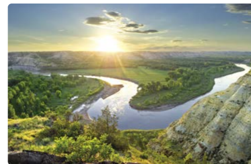
Parque Nacional Theodore Roosevelt

Día 2 > Tomamos rumbo hacia a las Black Hills (Colinas Negras) en Dakota del Sur. Se trata de un trayecto relativamente extenso, pero que merece la pena. En las Black Hills se encuentran algunas de las atracciones más icónicas de los EEUU, por no hablar de sus carreteras secundarias y las vistas que esperan en cada vuelta, formaciones rocosas y colinas boscosas. 240 millas (386,16 km) hasta Hot Springs ★ Visitar el Parque Nacional de Wind Cave (Cueva del Viento) o el yacimiento paleontológico activo de Mammoth Site (el Yacimiento de Mamuts). www.nps.gov/wica/planyourvisit/campgrounds.htm