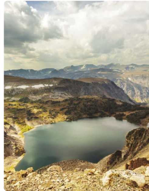
La montaña del Trueno (Thunder Mountain) desde la carretera eartooth, Montana

Día 3 > Hoy nos vamos a encontrar cara a cara con los bustos de los presidentes Washington, Jefferson, Roosevelt y Lincoln en el Monumento Nacional de Mount Rushmore. Menos conocido, pero a poca distancia se encuentra el monumento de Crazy Horse (Caballo Loco), en honor al guerrero nativo americano. Se trata de un trabajo en curso, pero, una vez concluido, tendrá una altura de 171 metros y 195 metros de longitud. 150 millas (241,35 km) hasta el parque nacional de Badlands pasando por el monte Rushmore ★ Tomar la Iron Mountain Road (Carretera de Montaña del Hierro) y la autovía de Needles (Agujas) para disfrutar de unas vistas espectaculares. Finalizar el día con una puesta de sol sobre las mesetas, barrancos y cañones del Parque Nacional de Badlands. https://www.cedarpasslodge.com/campground