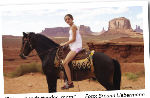
"Sólo un par de tiendas, mami"

Día 10 > Nos daremos un margen de dos horas "holgadas" para llegar hasta la sucursal de Cruise America, especialmente en hora punta. 110 millas (176,99 km) hasta Cruise America para devolver nuestra autocaravana.