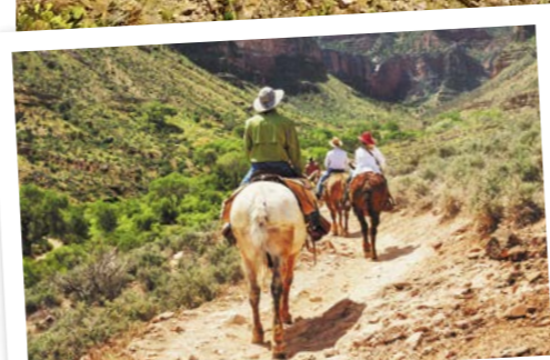
Ruta a caballo, Parque Nacional del Gran Cañón