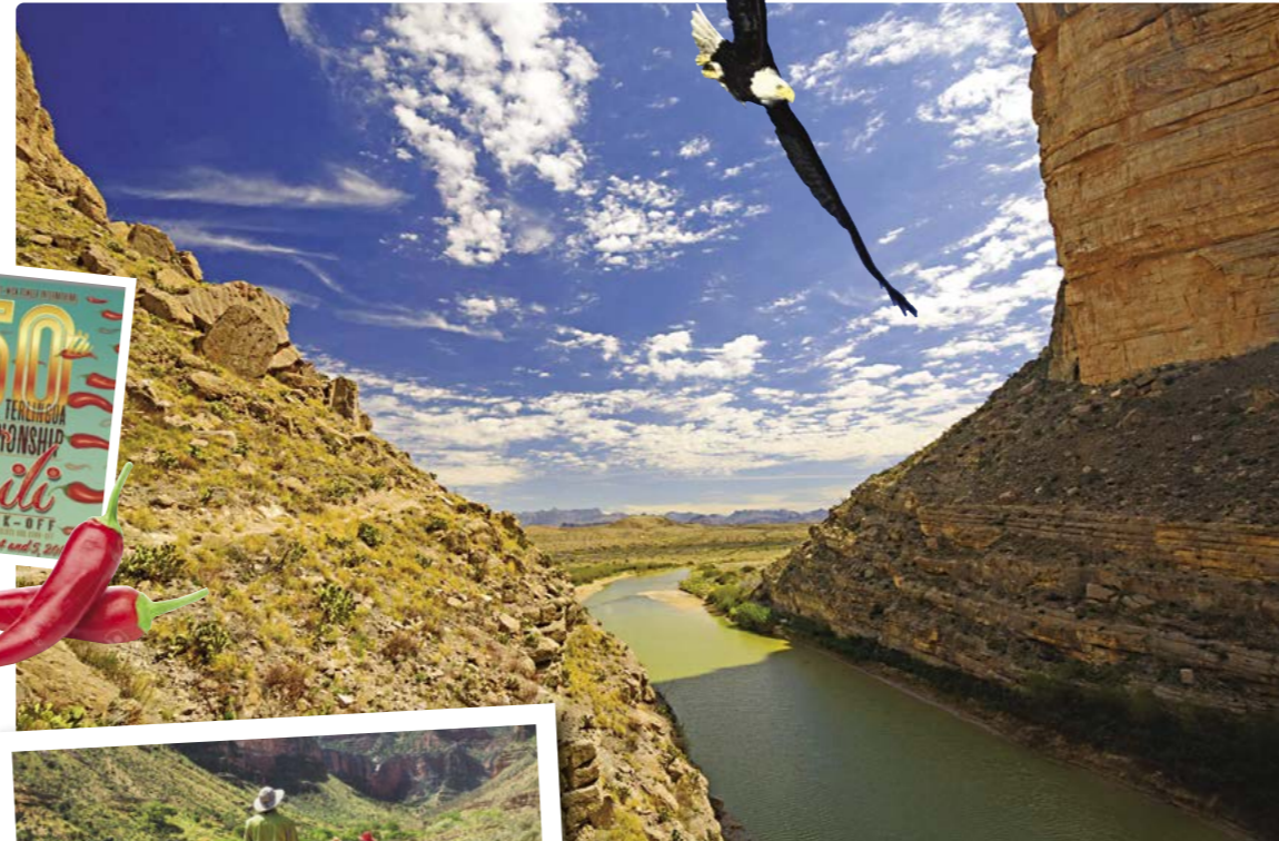
Cañón Santa Elena, Parque Nacional Big Bend

Día 9 > Hoy nuestro recorrido será algo más extenso, porque nos dirigiremos al norte, saliendo de Lajitas al Parque Nacional de las Montañas Guadalupe, con multitud de alternativas de senderismo y acampada para disfrutar de una de las zonas más prístinas de los Estados Unidos. 283 millas (455,3 km) hasta el Parque Nacional de las Montañas de Guadalupe . https://goo.gl/W3aHDQ