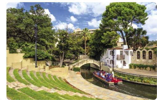
Paseo del río, San Antonio

Día 3 > Hoy partimos hacia las Cavernas de Sonora haciendo una parada en el pueblo de Fredericksburg, en la comarca de Texas Hill, de clara influencia germana, para visitar el Museo Nacional de la Guerra del Pacífico o de una cata de vinos de las excelentes bodegas de la zona. Desde aquí seguimos hacia las Cavernas de Sonora, de gran belleza y consideradas unas de las más impresionantes del mundo. 203 millas (326,6 km) hasta las Cavernas de Sonora ★ Visitar las Cavernas de Sonora y tomar una visita guiada para conocer los secretos de esta joya. Haremos noche en el camping próximo a las cavernas. http://www.cavernsofsonora.com/camping