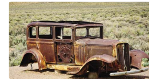
Restos oxidados en un viejo automóvil en el Parque Nacional del Bosque Petrificado

Día 11 > Dedicaremos la mañana a explorar el centro de Las Cruces. La mayor ciudad de Nuevo Méjico será nuestro destino de hoy y, de camino, podremos parar en 'Truth or Consequence (Verdad