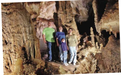
Cuevas en Sonora

Día 4 > Seguimos hacia Fort Davis por Fort Stockton donde podemos tener una toma de contacto con la Historia del Viejo Oeste, con una gran oferta culinaria, de ocio y de compras. En Fort Davis exploraremos el puesto militar fronterizo en el lugar de interés histórico de Fort Davis (Fort Davis National Historic Site). 232 millas (373,2 km) hasta Fort Davis ★ Dejarse inundar por la belleza natural del Centro de la Naturaleza del Desierto de Chihuahua y visitar sus jardines botánicos, o visitar el impresionante Observatorio McDonald para conocer más sobre el cosmos. https://goo.gl/gAFyxE