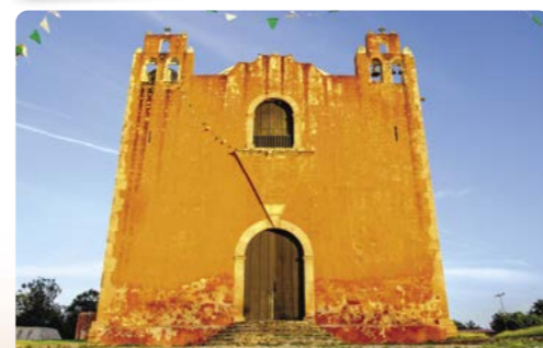
Iglesia colonial típica en Santa Elena