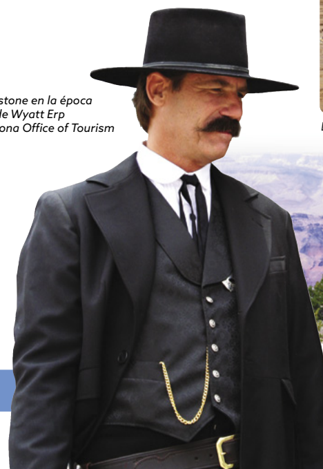
Tombstone en la época de Wyatt Earp