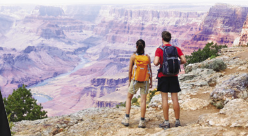
Excelentes vistas del Gran Cañón