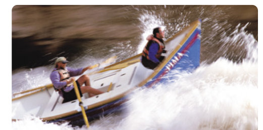
Rápidos en el río Colorado