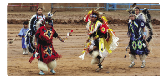
Danza fúnebre india