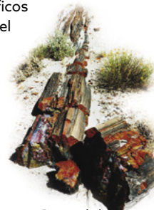
Restos de bosque petrificado