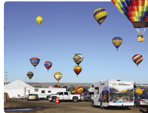
El festival de los globos, Albuquerque

Día 6 > El camping Mather, en el borde sur del Parque Nacional del Gran Cañón es estupendo. No dispone de tomas de agua o de corriente pero ofrece duchas y retretes que funcionan con