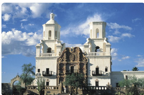
Misión San Xavier del Bac, Tucson