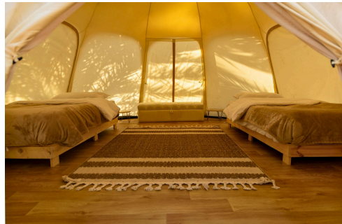
Al Mahzan Farm