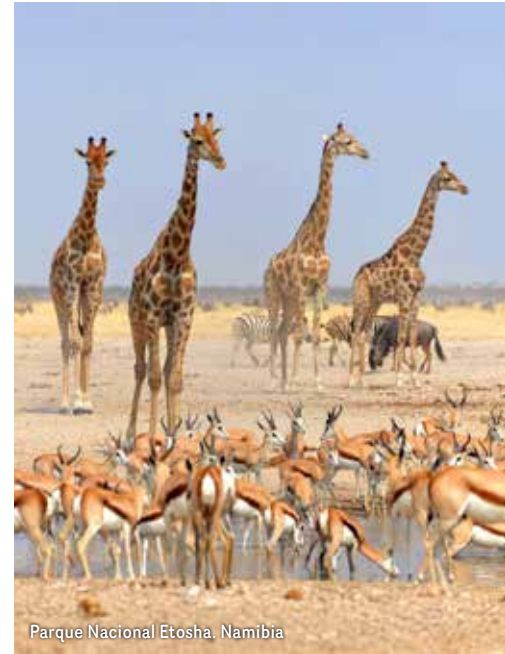
Parque Nacional Etosha, Namibia