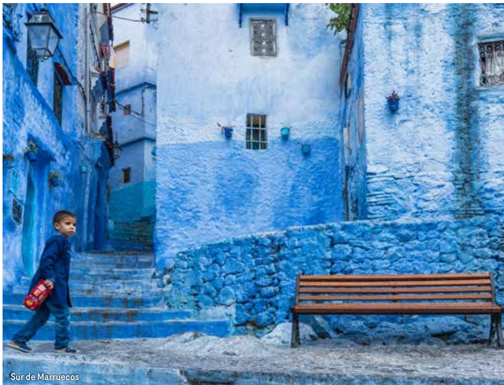
Sur de Marruecos

Desayuno temprano. Salida hacia el norte en una jornada de paisajes cambiantes: de las arenas del Sahara al frescor de los bosques de cedros. Atravesamos Er Rachidia, Midelt, las llanuras del Medio Atlas y los cedrales donde habitan los monos de Berbería. Parada en Ifrane, sorprendente ciudad con arquitectura alpina y jardines cuidados. Llegada a Fez, la capital espiritual e intelectual de Marruecos. Cena y alojamiento.