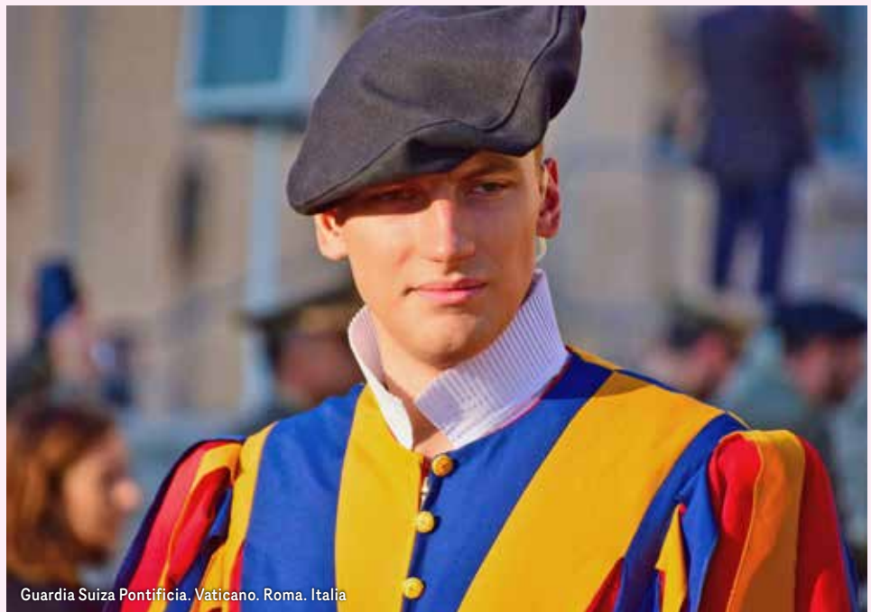
Guardia Suiza Pontificia. Vaticano. Roma. Italia

Desayuno y fin de nuestros servicios. Posibilidad de ampliar su estancia en España o participar en un circuito por Andalucía o Portugal.